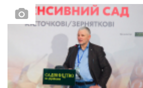
Конференції Міжнародний практичний форум